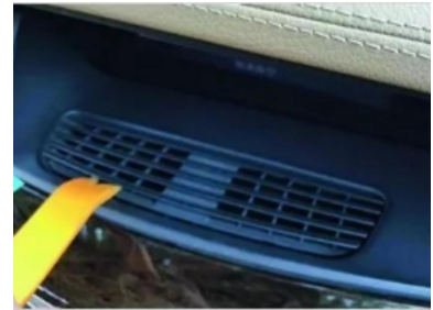
3. Hebeln Sie die Lüftungsblende der Klimaanlage unterhalb des Bildschirms heraus.