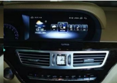
21. Effektbild nach der Installation