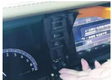
9. Hebeln Sie die Original-Bildschirmblende des Fahrzeugs ab.