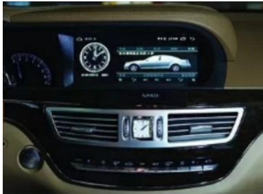
20. Effektbild nach der Installation