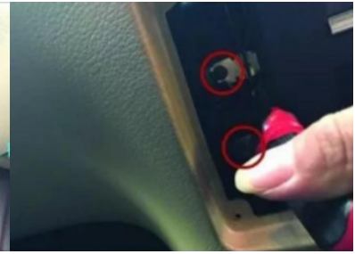
18. Entfernen Sie die Befestigungsschrauben des CD-Players