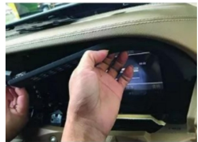
6. Hebeln Sie die Original-Bildschirmblende des Fahrzeugs ab.