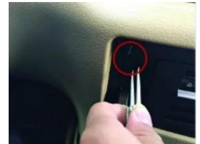
12. Öffnen Sie mit einer Pinzette die Clips am Rahmen des CD-Players und entfernen Sie die Befestigung.