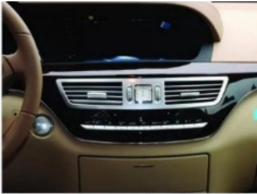
1. Zentrale Steuerung des Originalfahrzeugs