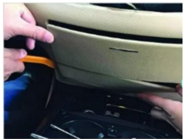
13. Aufhebeln die CD-Player-Blende