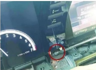
8. Entfernen Sie die Befestigungsschrauben der ursprünglichen Blende.