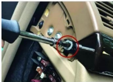
2. Hebeln Sie die linke und rechte Seitenblende ab und entfernen Sie deren Befestigungsschrauben