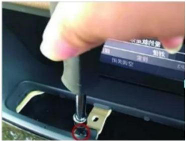
4. Lösen Sie die Befestigungsschrauben der Lüftungsgitterblende der Klimaanlage