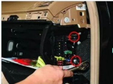
19. Entfernen Sie die Befestigungsschrauben an der rechten Sicherung