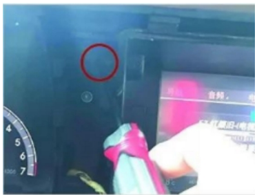
10. Entfernen Sie die Befestigungsschrauben der originalen Tastenblende.