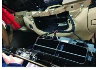
5. Hebeln Sie die zentrale Steuerkonsole ab und ziehen Sie das Netzkabel ab