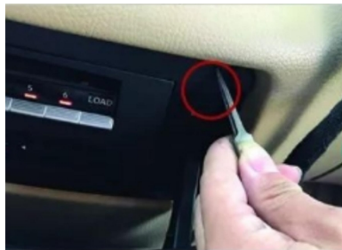
11. Verwenden Sie eine Pinzette, um die Klammern am Rahmen des CD-Players aufzubrechen, und entfernen Sie die Befestigung.