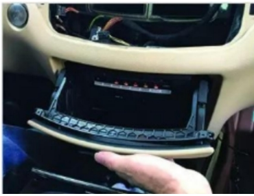
16. Entfernen Sie die CD-Player-Abdeckung Befestigungsschrauben des CD-Players