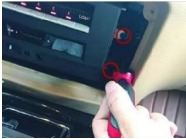
17. Entfernen Sie die