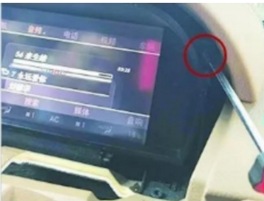
7. Entfernen Sie die Befestigungsschrauben der Original-Bildschirmblende