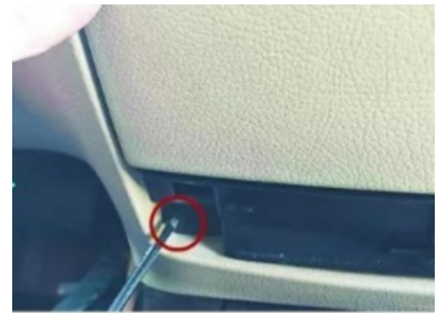
15. Entfernen Sie die Befestigungsschrauben des CD-Playergehäuses.